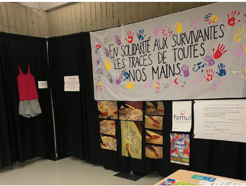
Exposition Que portais-tu? présentée au PEPS à l'occasion du Mois de l'histoire des femmes, en collaboration avec les Féministes en mouvements de l'Université Laval (FÉMUL).

voit enrichie lors des présentations en salle. C'est que la participation y est plus dynamique, les questions plus fréquentes et le contenu de formation s'en trouve ainsi bonifié. Pour ces raisons, le retour des formations tenues sur le campus est donc attendu par l'équipe du CIPVACS. Une seule offre en présence aura pu être tenue en 2021-2022.